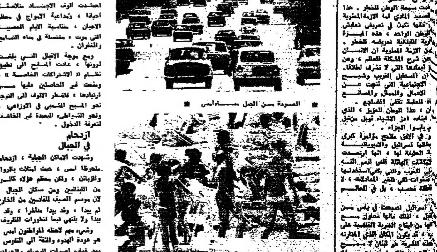
المسودة من اجل مساكن امس

ودعت العاصمة لبث ، اسبوعا كايلا من الجهود والاستقرار ، وهي اند نفالوا باستمرار الحياة الطبيعية . كانت تنفض عنها غيل الخوف والقلق ، لستقبل الازم المقبلة وهي اكثر الخطانا وسعادة . وقدر « الهروب » الاثري من العاصمة ، كان الازبال على المسبح والشواطئ والامكن الجبلية العالية . بعض سكان العاصمة « حاربوا » الحرارة ببرودة الجبال ، وبعضهم حارب على « جبة البحر » حيث اصعدت الازم الاضداد خلاصتها احيانا ، وداعية الازواج في معظم الاحيان ، مناصحة الازم المصيبة التي مرت ، منصفة في ماء التسامح والفرحان . ومع موجة الازبال التي بلغت لورونها ، غابت المسبح الى نظيف نظام « اشتراكات الخاصة » ، ومنتع غير الحاصلين عليها من ارتدادها ، ناقضت الازواج الى التوجه نحو المسبح لتستريح في الازواجي ، ونحو الشواطئ البعيدة غير الخاصة لتعرفه الدخول . ازحام في الجبال وشهدت الامكن الجبلية ، ازحاما ملحوظا ، حيث امتلأت بالزوار والزبائن ، ولكن معظم هؤلاء كانوا من اللبنانيين ومن سكان الجبال ، لان موسم الصيف للناشرين من الخارج لم يبدأ ، وقد يبدأ ملاحرا ، وقد لا يبدأ ولا ينتهي فيما تطورات الظروف . وشبه مهم لحاظه المواطنين امس ، هو عودة الهدوء والنقا الى القريوس ، بعد غياب اصوات الرصاص والحواش العربية .